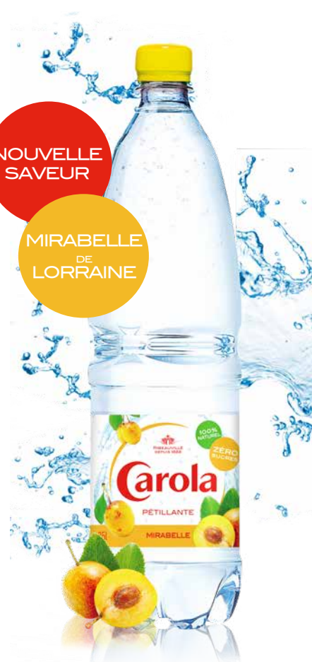
MIRABELLE 1,25 L